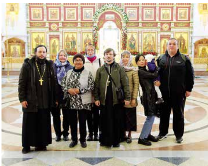
День Светлой Пасхи для православных аборигенов