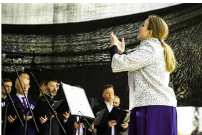
Выступление сводного хора Хабаровской епархии