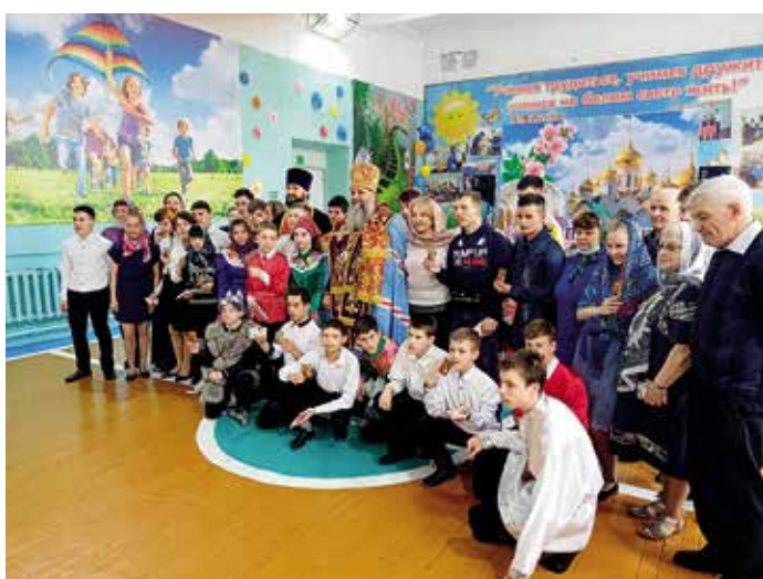
Митрополит Хабаровский и Приамурский Артемий поздравил со Светлым Христовым Воскресением воспитанников школы-интерната №4