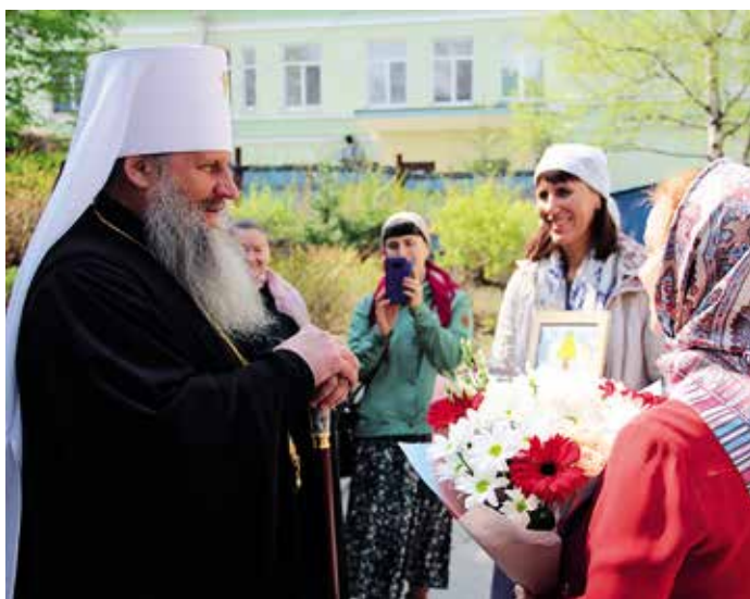
Митрополит Артемий посетил Центр духовно-нравственного воспитания «Русская классическая школа»