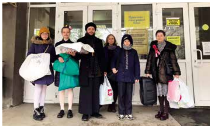
Настоятель и прихожане храма св Иннокентия Иркутского посетили онкогематологическое отделение «Детской краевой клинической больницы» имени А. К. Пиотровича